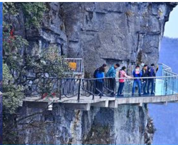
หน้าพลาวยฟ้าทางเดินกระจก