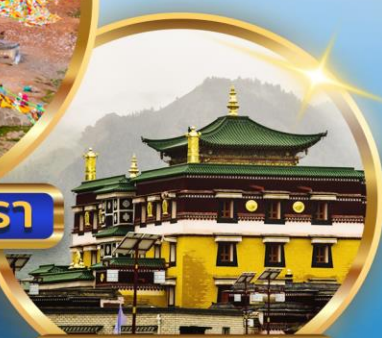
วัดลาปูหลุนสี่