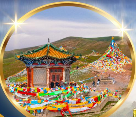
ภูเขาสุริยันจันตรา