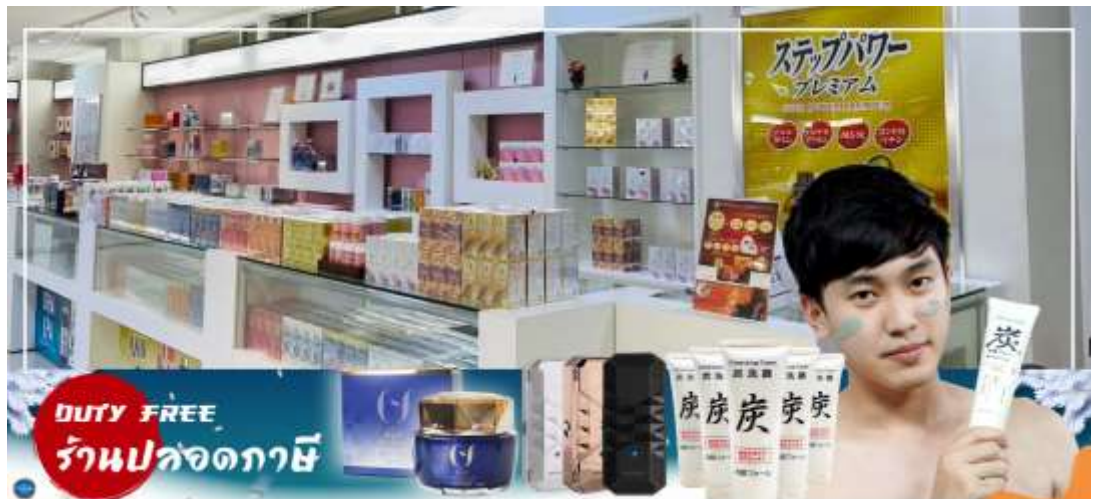
DUTY FREE ร้านปลอดภาษี

จากนั้นเดินทางสู่ เมืองอาซาฮิคาว่า (Asahikawa) (ใช้เวลาเดินทางประมาณ 2.30 ชั่วโมง) เป็นเมืองใหญ่อันดับ 2 ของจังหวัดซอกไกโด รองจากเมืองซัปโปโร เป็นเมืองศูนย์กลางทางตอนเหนือของเกาะ ล้อมรอบด้วยเทือกเขาไดเซ็ตสึชั้นและแม่น้ำน้อยใหญ่ มีแหล่งท่องเที่ยววันหยุดนียมอยู่หลายแห่ง