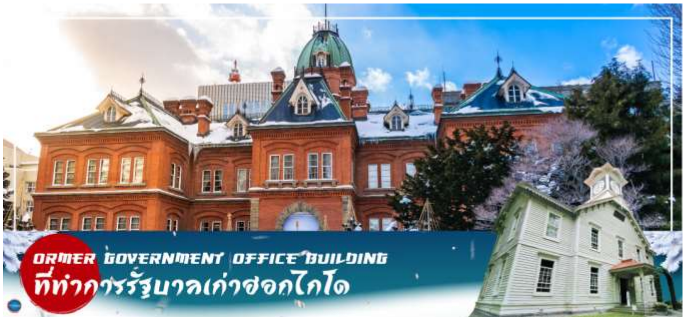
FORMER GOVERNMENT OFFICE BUILDING ที่ทำการรัฐบาลเก่าซอกไกโด

วันที่สี่ เมืองซัปโปโร – ดิวตี้ฟรี – ผ่านชม ศาลาว่าการเมืองซอกไกโดหลังเก่า – ผ่านชม หอนาฬิกาเมืองซัปโปโร – เมืองอาซาฮิคาว่า – โซออนเคียว – ภูเขาคุโรดาเกะ (นั่งกระเช้า)**ขึ้นอยู่กับสภาพอากาศ** – ออนเซน