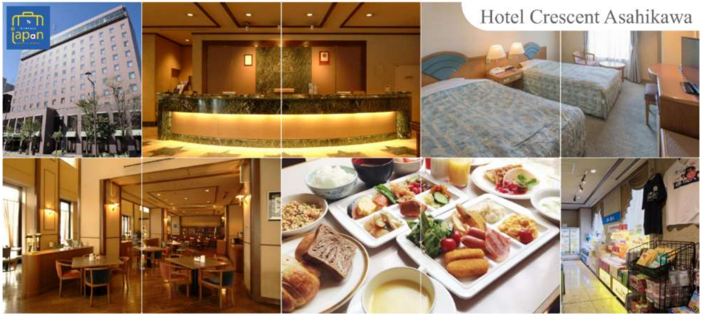
Hotel Crescent Asahikawa

รับประทานอาหารเย็น ณ ภัตตาคาร (10) HOTEL CRESCENT ASAHIKAWA หรือเทียบเท่าระดับเดียวกัน