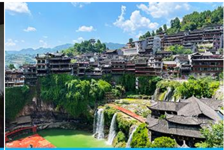
เมืองโบราณฝูหรงเจิ้น