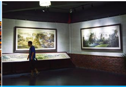
พิพิธภัณฑ์ภาพถ่ายหินทราย