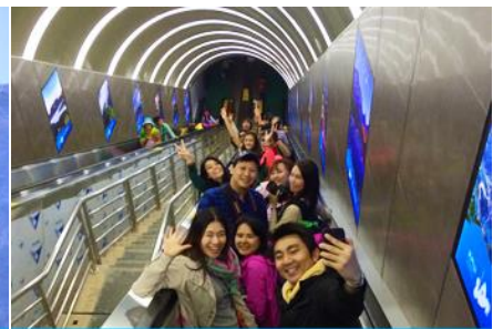
บันไดเลื่อนทะเลภูเขา