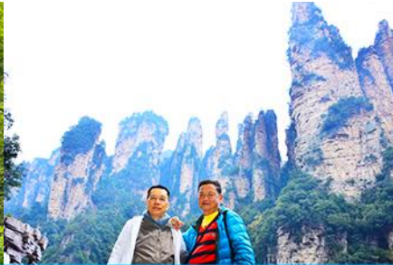
ชมจุดชมวิวลีฟท์แก้ว