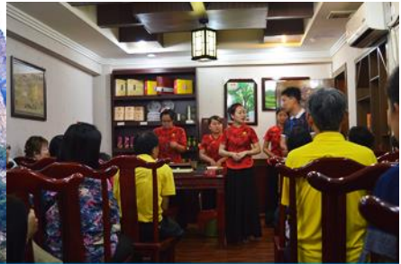
ร้านใบชา

วันที่ห้า เมืองจางเจียเจีย- เลือกซื้อโปรแกรมทัวร์เสริมออฟชั่น อุทยานอวตารจุดชมวิวจินเปียนซี- ชมจุดชมวิวลีฟท์แก้ว-ร้านใบชา-เดินทางกลับเมืองหยี่ซัง