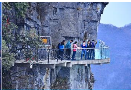
หน้าพลาวยฟ้าทางเดินกระจก