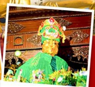
ขอพรแม่ยักยี