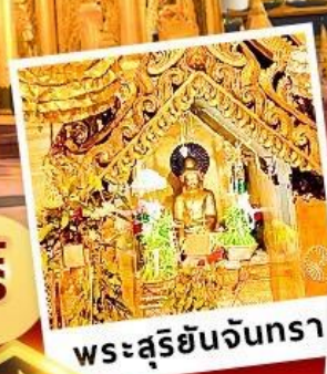
พระสุริยันจันทรา