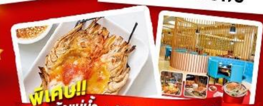
พิเศษ!! กุ้งแม่น้ำ + HOTPOT SEAFOOD