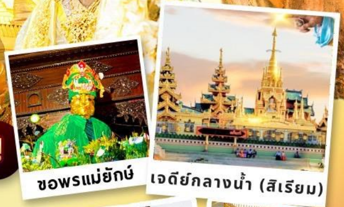
ขอพรแม่ยักษ์