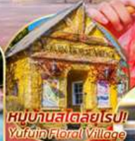
หมู่บ้านสโตร์ยโร! Yuinok Floral Village