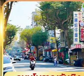
ถนนโบราณอันผิง