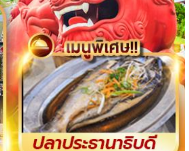
เมนูพิเศษ!! ปลาประราหาริบตี