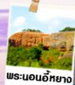
พระนอนอภัยวง