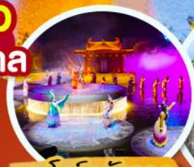
ชมโชว์อุทนีโจว