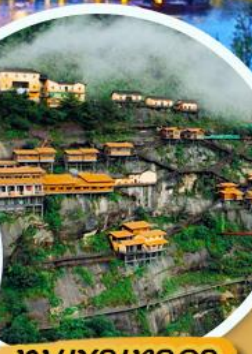
หมู่บ้านทวงหลือ

เมนูพิเศษ!! เปิดปากกึ่ง หมูแดง ปลาหมึกเบียร์อภัยวง