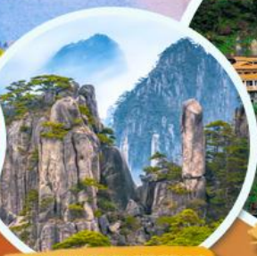
ภูเขาหวงชาน