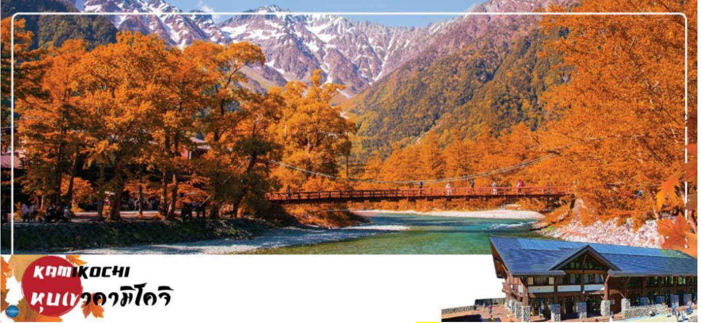
KAMIKOCHI หุบเขาคามิโคจิ