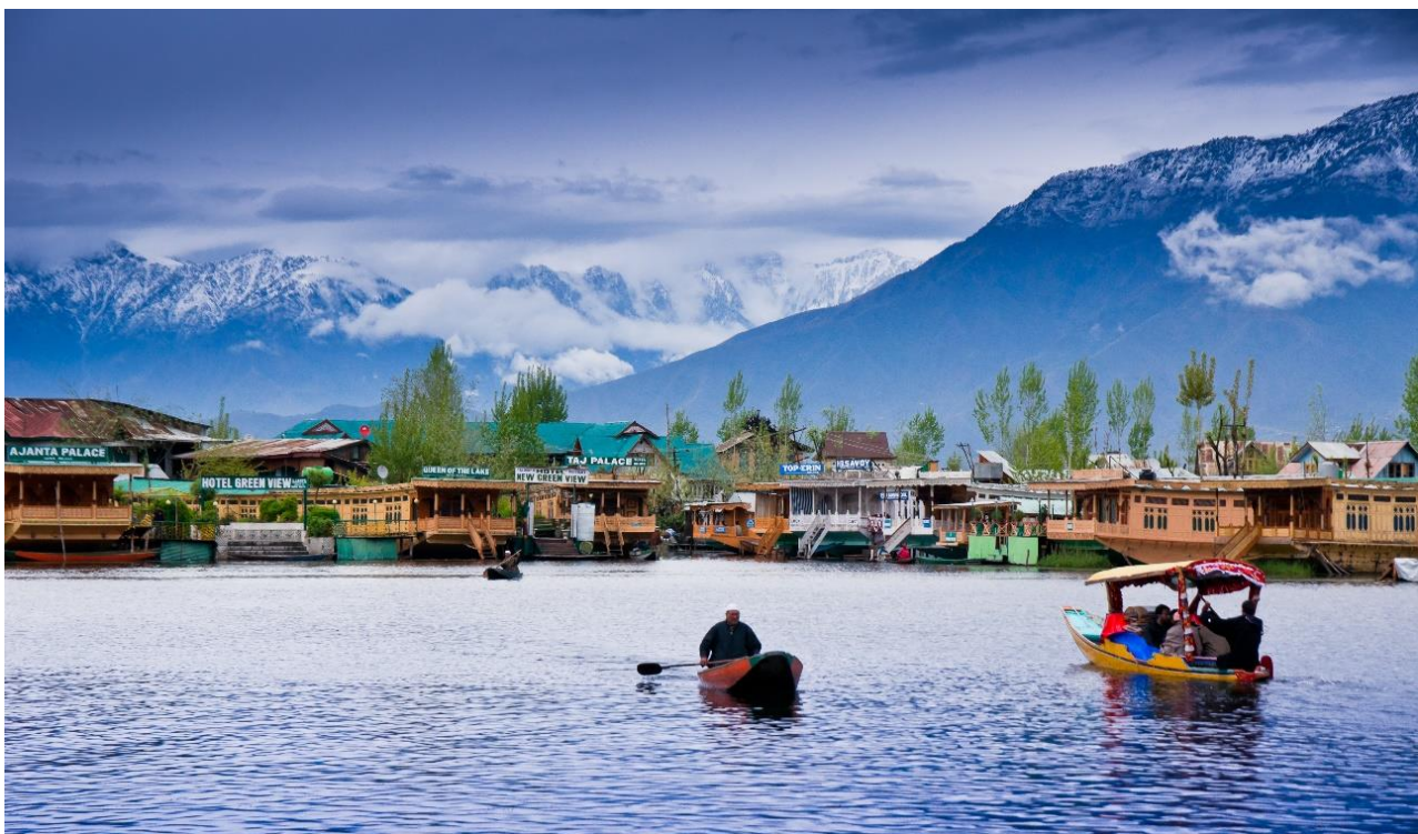
ล้อมโดยรอบ ในสมัยที่ถูกปกครองโดยราชวงศ์โมกุล มีการจัดทำผังเมืองขึ้นมาใหม่ จึงทำให้แคชเมียร์เป็น

เช้า บริการอาหาร ณ ห้องอาหารของโรงแรม 07.40 ออกเดินทางสู่ ท่าอากาศยานศรีนาคา เมืองแคชเมียร์ ประเทศอินเดีย โดยสายการบิน INDIGO เที่ยวบินที่ 6E 5201 09.10 เดินทางถึง ท่าอากาศยานศรีนาคา รัฐแคชเมียร์ ประเทศอินเดีย หลังผ่านขั้นตอนการตรวจหนังสือเดินทาง และตรวจรับสัมภาระเรียบร้อยแล้ว นำท่านสู่ตัว เมืองศรีนาคา (SRINAGAR) ซึ่งเป็นเมืองหลวงของแคชเมียร์ ประกอบด้วยทะเลสาบขนาดใหญ่ คือ ทะเลสาบดาล และ ทะเลสาบนากิน ด้านหลังมีเทือกเขาโอบ