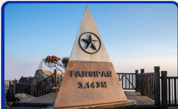
นั่งกระเช้าสู่ยอดเขาฟานซิปัน