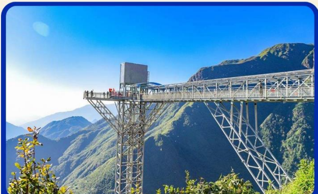
สะพานแก้วมังกรเมฆ (Rong May Glass Bridge)