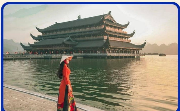
จุดเช็คอินแห่งใหม่ “วัดตามจ๊ก”