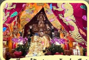
• เอียงบู๊ซิว (ศาลเจ้าพ่อเสือ)