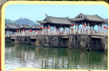
• สะพานโบราณกว่างจี้