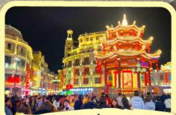
• ถนนโบราณเสี่ยวกงหยวน