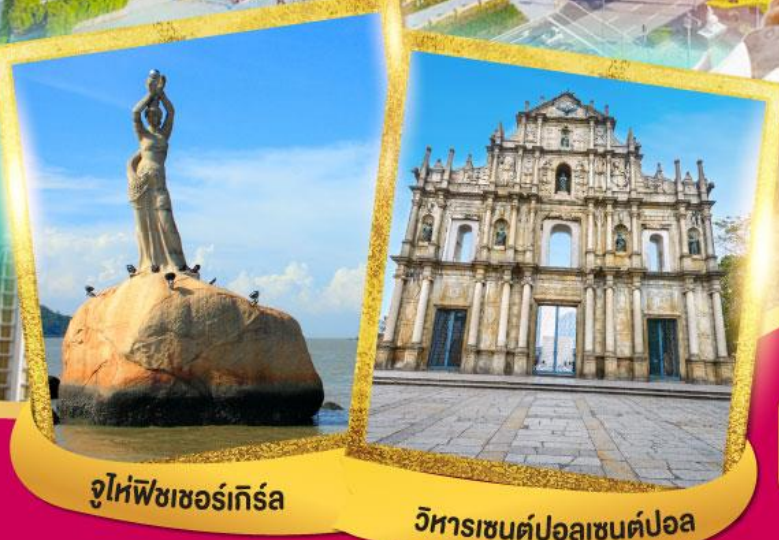
จูไห่พีซเซอร์เกิร์ล