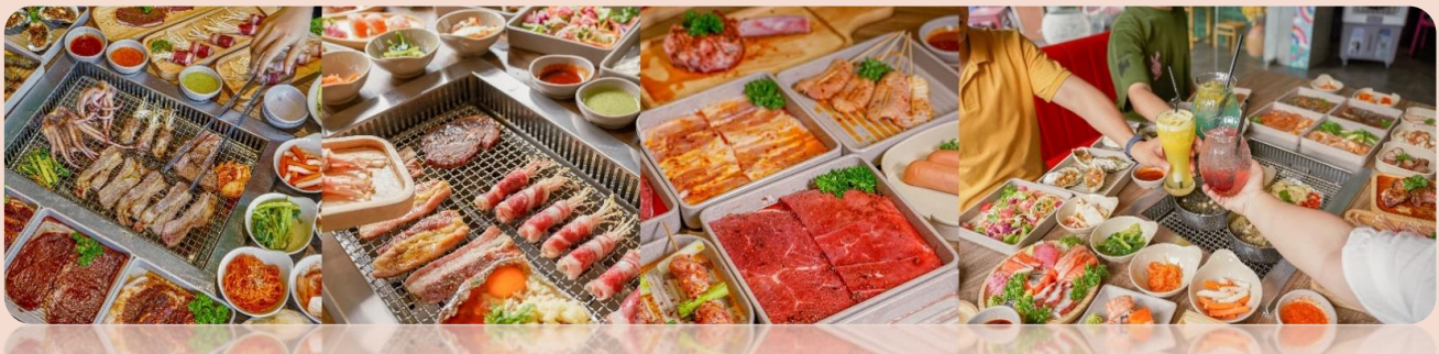
ที่พัก โรงแรม Glamour, Samdi Hotel , Hadana Hotel หรือเทียบเท่าระดับ 4 ดาว

วันที่สี่ ตลาดฮาน • ท่าอากาศยานนานาชาติดานัง • กรุงเทพฯ (ท่าอากาศยานสุวรรณภูมิ) (VZ961 : 13.15 – 14.55)