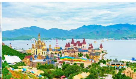
VinWonders NHA TRANG