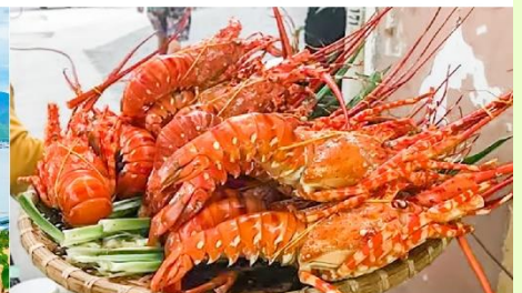
Nha Trang Night Market

*ทางบริษัทฯ ขอสงวนสิทธิ์ในการสลับโปรแกรมทัวร์ตามความเหมาะสมขึ้นอยู่กับสถานการณ์หน้างาน โดยคำนึงถึงผลประโยชน์ของลูกค้าเป็นสำคัญ