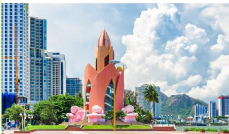
Tram Hung Tower